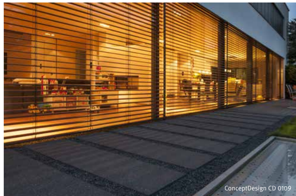
ConceptDesign CD 0109