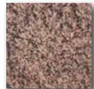
Beige-braun gemasert (Detail)