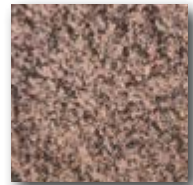
Beige-braun gemasert (Detail)