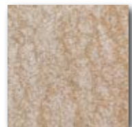
Granitbeige gemasert (Detail)